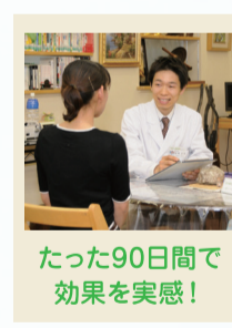
たった90日間で 効果を実感!